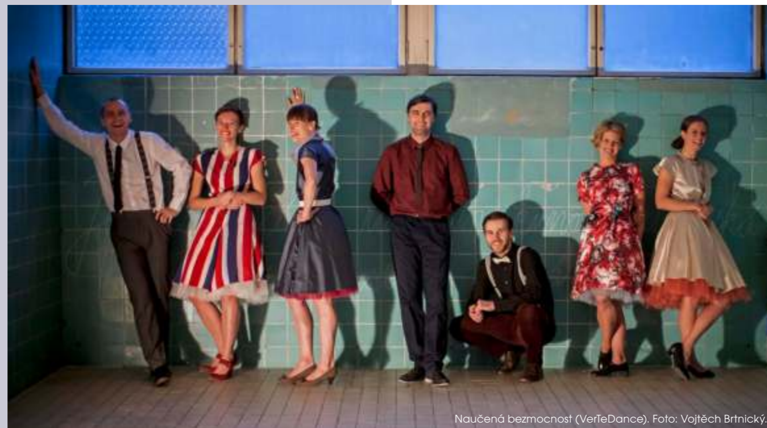
Naučená bezmocnost (VerTeDance).