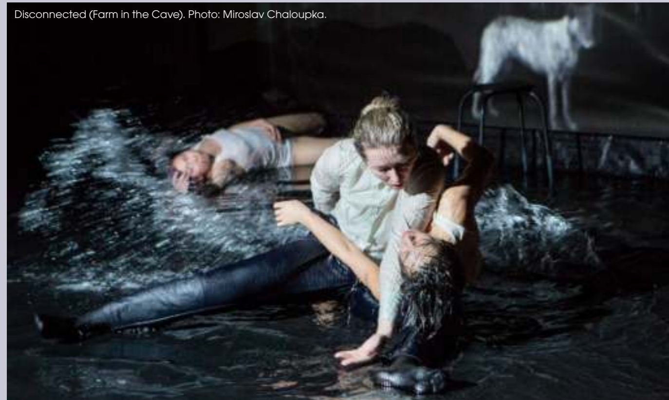
Disconnected (Farm in the Cave).