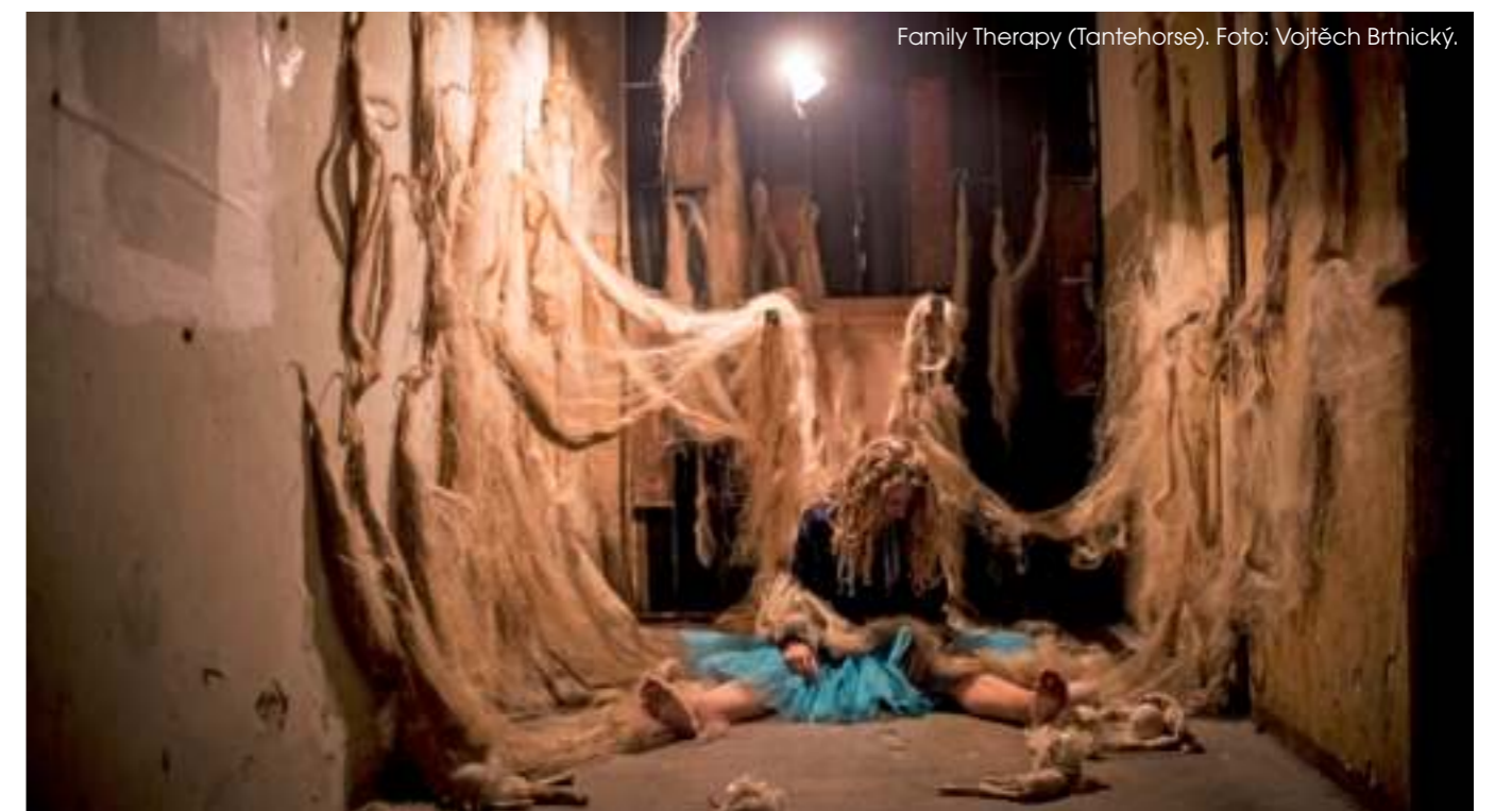
Family Therapy (Tantehorse).