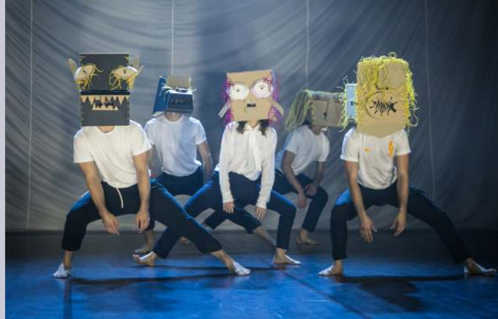
O medvědovi, který plul na kře (Burki&com).